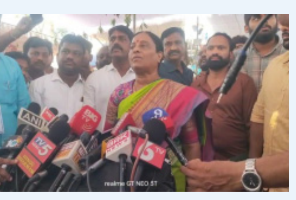
నేడు కళ్యాణ మహోత్సవాన్ని తిలకించిన భక్తులందరికీ శ్రీ రామచంద్ర స్వామి ఆశీస్సులు ఉండాలని, ప్రజా ప్రభుత్వానికి శ్రీరామచంద్రమూర్తి శక్తిని కల్పించి ప్రజలకు మెరుగైన సేవలు అందించేందుకు ఆశీర్వదించాలని మంత్రి కోరారు.

భద్రాచలం, మార్చి 27 (భారతశక్తి): గోదావరి పుష్కరాల నాటికి తొలి దశ ఆలయ అభివృద్ధి పనులు పూర్తి చేస్తామని రాష్ట్ర దేవదాయ, ధర్మాదాయ శాఖ మంత్రి కొండా సురేఖ పేర్కొన్నారు. శుక్రవారం భద్రాచలంలోని శ్రీ సీతారామ చంద్ర స్వామి కళ్యాణ మహోత్సవ కార్యక్రమం అనంతరం మంత్రి కొండా సురేఖ మీడియాతో మాట్లాడుతూ భద్రాచలంలోని శ్రీ సీతారాముల వారి కళ్యాణానికి ప్రాముఖ్యత ఉందని, దేశ వ్యాప్తంగా కోట్లాది మంది ప్రజలు శ్రీ సీతారామచంద్ర స్వామి కళ్యాణాన్ని వీక్షిస్తారని, ప్రజా ప్రభుత్వం ఏర్పడిన తర్వాత మూడవ సంవత్సరం మంత్రిగా తాను ఈ కళ్యాణ మహోత్సవ వేడుకల్లో పాల్గొనడం సంతోషంగా ఉందని తెలిపారు. ముఖ్యమంత్రి రేవంత్ రెడ్డి భద్రాచలం ఆలయాన్ని అభివృద్ధి చేయాలనే లక్ష్యంతో డిప్యూటీ సీఎం, స్థానిక మంత్రుల సహకారంతో అవసరమైన భూ సేకరణ చేసిన తర్వాత, రాబోయే సంవత్సరం గోదావరి పుష్కరాలు జరుగుతున్న నేపథ్యంలో మొదటి విడత క్రింద భద్రాచలం ఆలయానికి రూ.351 కోట్ల రూపాయలతో చేపట్టే అభివృద్ధి పనులకు నేడు శంకుస్థాపన చేశామన్నారు. గోదావరి పుష్కరాల సమయానికి ప్రస్తుతం చేపట్టిన అభివృద్ధి పనులు పూర్తి చేసేందుకు దేవదాయ శాఖ కృషి చేస్తుందని తెలిపారు. అనంతరం రెండవ విడత నిధులు విడుదల చేసుకొని కృష్ణ పుష్కరాల నాటికి అభివృద్ధి పనులు పూర్తి చేయడం జరుగుతుందని మంత్రి తెలియజేశారు. నేడు కళ్యాణ మహోత్సవాన్ని తిలకించిన భక్తులందరికీ శ్రీ రామచంద్ర స్వామి ఆశీస్సులు ఉండాలని, ప్రజా ప్రభుత్వానికి శ్రీరామచంద్రమూర్తి శక్తిని కల్పించి ప్రజలకు మెరుగైన సేవలు అందించేందుకు ఆశీర్వదించాలని మంత్రి కోరారు.