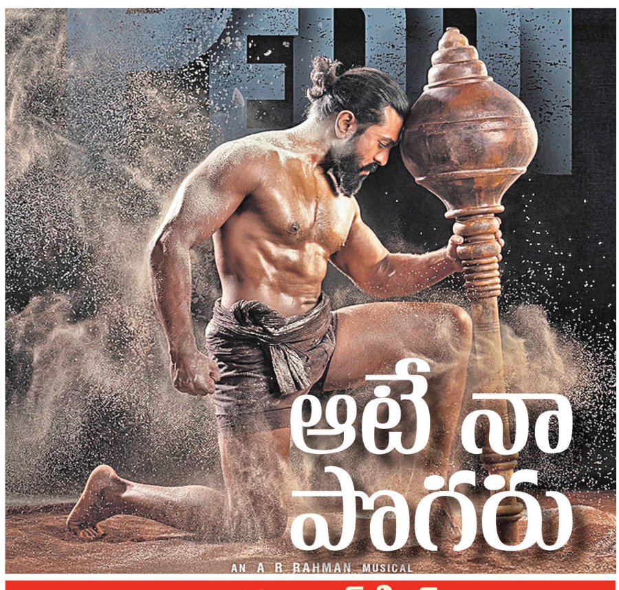
'పెద్ది' పహిల్వాన్ గ్లింప్స్

మెగా పవర్ స్టార్ రామ్ చరణ్ హీరోగా బుచ్చిబాబు తెరకెక్కిస్తున్న సినిమా 'పెద్ది'. ఏప్రిల్ 30న ఈ చిత్రం విడుదలవనుంది. తాజాగా చరణ్ బర్త్ డే సందర్భంగా మూవీ టీం అదిరిపోయే గిఫ్ట్ ఇచ్చింది. 'పెద్ది పహిల్వాన్ గ్లింప్స్' పేరుతో స్పెషల్ వీడియోను మేకర్స్ రిలీజ్ చేశారు. ఇందులో మల్లయోధు డిలా రామ్ చరణ్ గెటప్, అతను కుస్తీ కోసం తీసుకుంటున్న శిక్షణ, పోటీలో తలపడే తీరు అదుర్స్ అనిపిస్తోంది. 'పెద్ది అంటే చావుకు ఎదురైతే ఆట', ఆటే నా పొగరు' అంటూ చెల్లెలి యాసలో డైలాగులు చెప్పడం విపరీతంగా ఆక